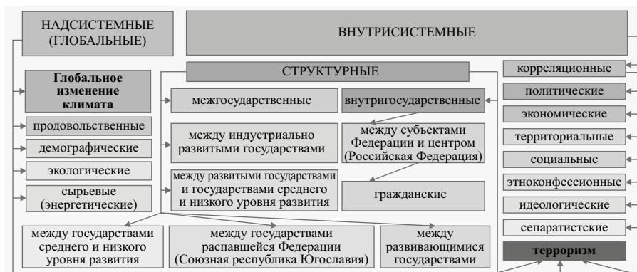
Слика 1. Варијанџа класификације главних противречности и сукоба у процесу развоја цивилизације према врсти њиховог решавања

Растућа претња активизације нових или проширења постојећих регионалних сукоба наводи руководство појединих држава да остваре политичке и војне циљеве користећи оружје за масовно уништење. Користећи креирану технолошко-производну базу, акумулиране ресурсе, једни су добили нуклеарно оружје и средства за његову испоруку (Израел, Индија, Пакистан, Иран, Северна Кореја), други улажу напоре да реше овај проблем, повећавајући ризик од нуклеарне пролиферације. То доприноси настанку нових жаришта напетости, активира тињајуће међунационалне, међуетничке, међуверске противречности, организовани криминал, трговину дрогом, миграционе токове избеглица, еколошке проблеме, ширење епидемија и глад. Борба против међународног тероризма постала је глобални проблем (Уси-ков et al., 2009: 14; Зверьков et al., 2022: 60).