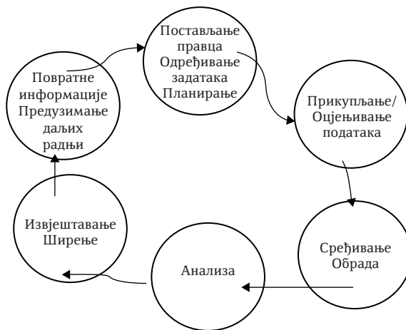
Графикон 2. Криминалистичко-обавјештајни циклус OSCE (2017). Раг полиције заснован на обавјештајним сазнањима. Беч.

Сљедећи корак је фаза у којој се, заправо, врши обрада која почиње сређивањем и структурисањем доступних података и информација и њиховим уносом у базу података. Подаци и информације се затим анализирају, што резултира изработом обавјештајног производа који се доставља клијенту (руководиоцу, истражитељу или другима који одређују задатак аналитичарима или захтијевају њихову аналитичку подршку) и другим релевантним актерима. Клијент оцјењује обавјештајни производ у складу са својим потребама и захтјевима. Добијене повратне информације користе се за унапређење постојећег производа или као улазни методолошки елементи за будуће сличне производе (OSCE, 2017: 34).