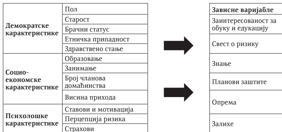
Слика 8. Концептуални модел предмета истраживања.

Предмет истраживања представља испитивање чиниоца утицаја одређених независних променљивих (пол, брачни статус, старост, образовање, занимање, висина прихода, број деце у породици, број чланова домаћинства и слично) на различите димензије припремљености за катастрофу узроковану шумским пожарима. Припремљеност грађана на катастрофе укључује више различитих димензија, при чему се истраживање фокусира на поседовање знања о начину реаговања у случају шумских пожара и поседовање планова заштите. Конкретније речено, истраживањем се жели утврдити утицај пола, старости, брачног статуса, етничке припадности, здравственог стања, дужине пребивалишта (демографске карактеристике), образовања, занимања, броја деце у породици, броја чланова домаћинства, комфора стана, висине прихода (социокономске карактеристике) на припремљеност грађана општине Пријепоље на катастрофу узроковану шумским пожарима. У истраживању утицаја демографских и социокономских карактеристика грађана на ниво њихове припремљености на ванредне ситуације изазване шумским пожарима, коришћен је статистички метод.